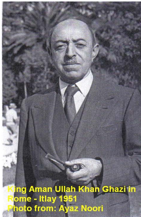
King Aman Ullah Khan Ghazi in Rome - Itlay 1951