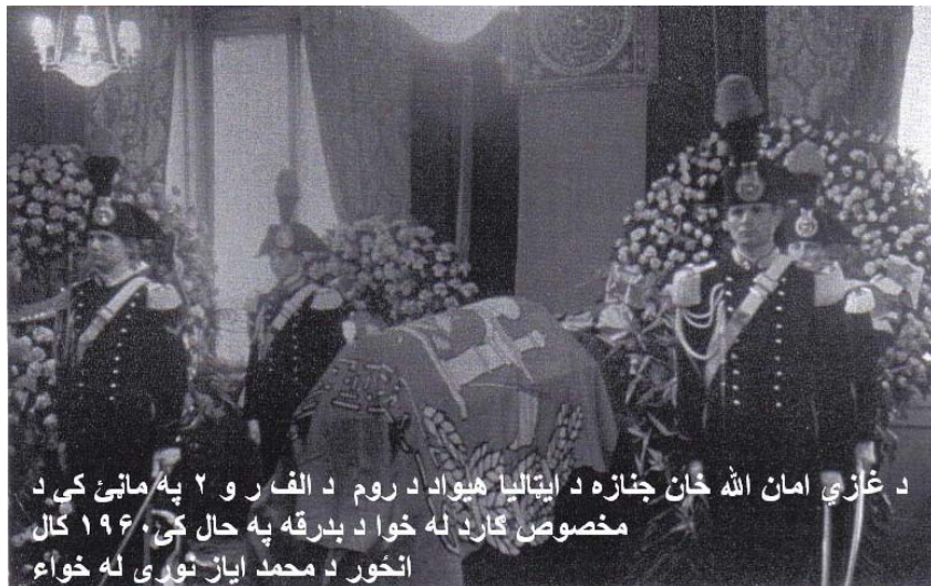
د غازي امان الله خان جنازه د ایټالیا هیواد د روم د الف و ۲ په مانې کې د مخصوص ګارد له خوا د بدرقه په حال کې ۱۹۶۰ کال

تابوت اعلیحضرت غازي امان الله خان در روم در سالون مخصوص و مکمل و با بدرقه ګارد احترام سال ۱۹۶۰ ع